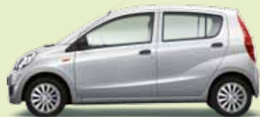
Arktissilber Perleffekt (S28)