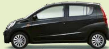
Schwarz Perleffekt (X07)