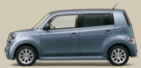
Stahlgrau Perleffekt (S30)