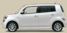
Weiß Perleffekt (W16)