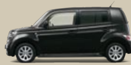
Schwarz Perleffekt (X07)